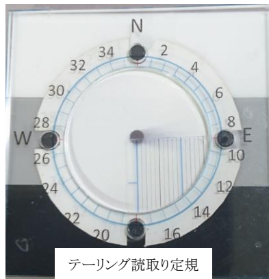
テーリング読取り定規