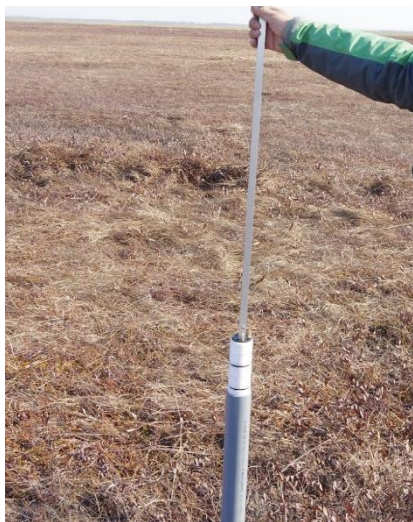
①ペーパー・スポンジをセットし、方位を確かめ 井戸のストレーナ区間に設置