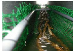
図2 本発明による遡上設備を配水管（パイプ）内に設置した図