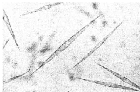
【図1】新規微細藻類の顕微鏡写真