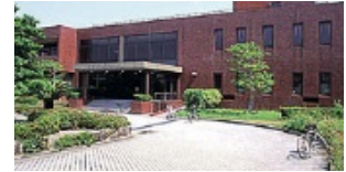
山口大学 大学会館