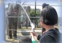
純水素型燃料電池システム 実証試験(徳山動物園)